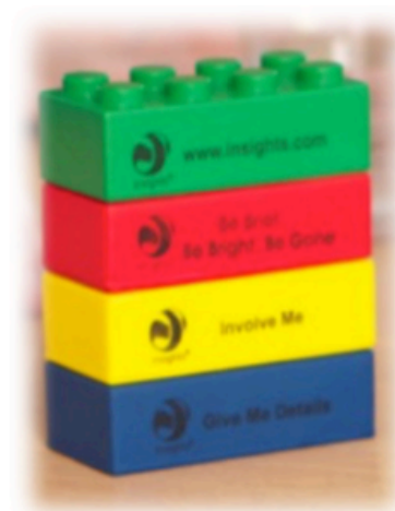
Bloques 4 Energías Cromáticas Discovery®