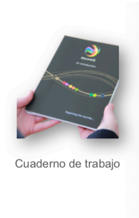
Cuaderno de trabajo