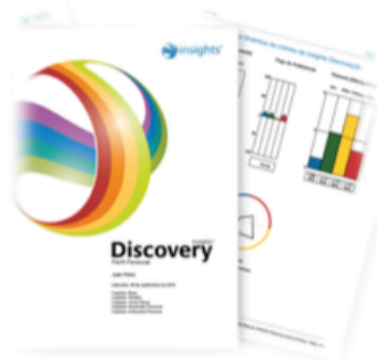
Perfil Personal Discovery®